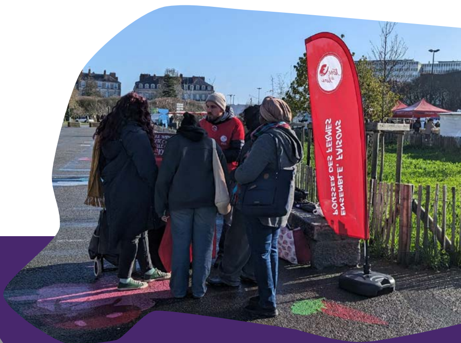
Actions de mobilisation pour les municipales 2026 - Nantes (44)