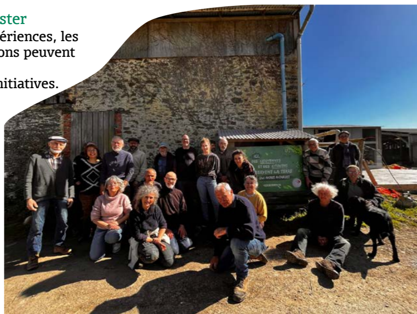
Ferme de la Bellangerie, après la plantation de haies - Arquenay (53)